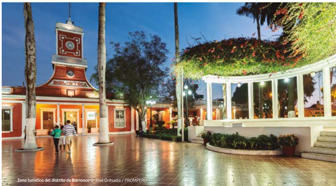
Zona turística del distrito de Barranco