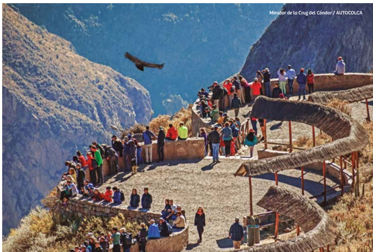
Mirador de la Cruz del Cóndor / AUTOCOLCA