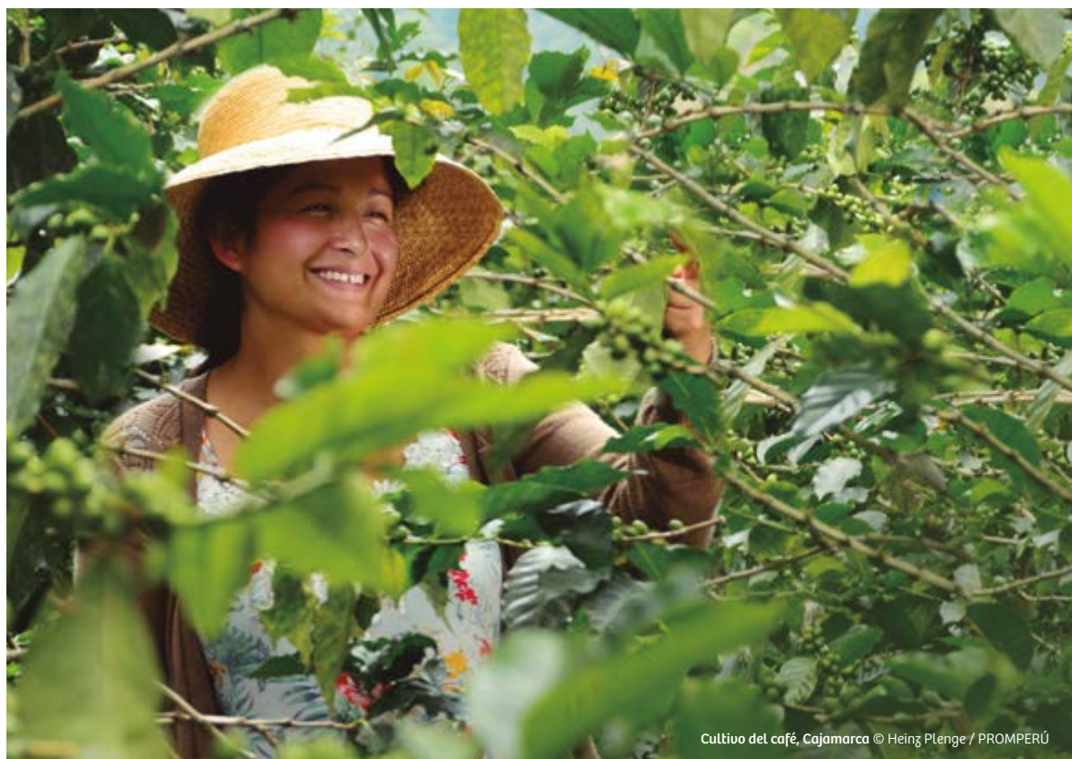
Cultivo del café, Cajamarca