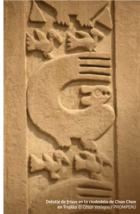
Detalle de frisos en la ciudadela de Chan Chan en Trujillo