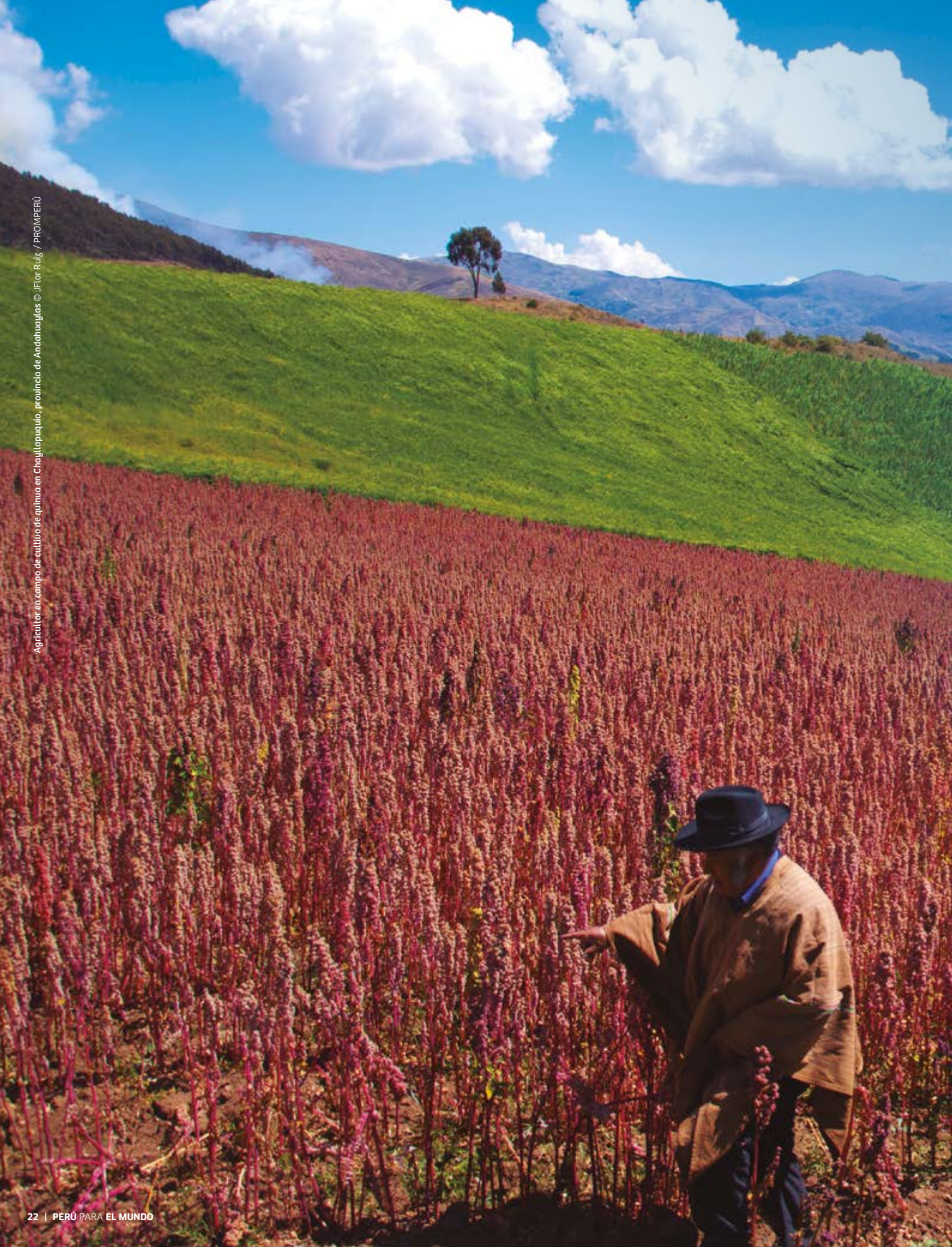
Agricultor en campo de cultivo de quinoa en Chayllapucquio, provincia de Andahuaylas