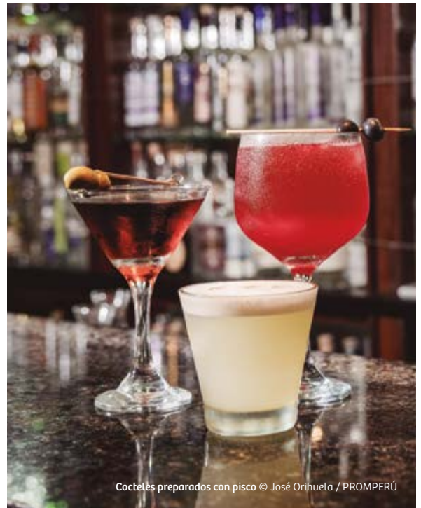
Cocteles preparados con pisco