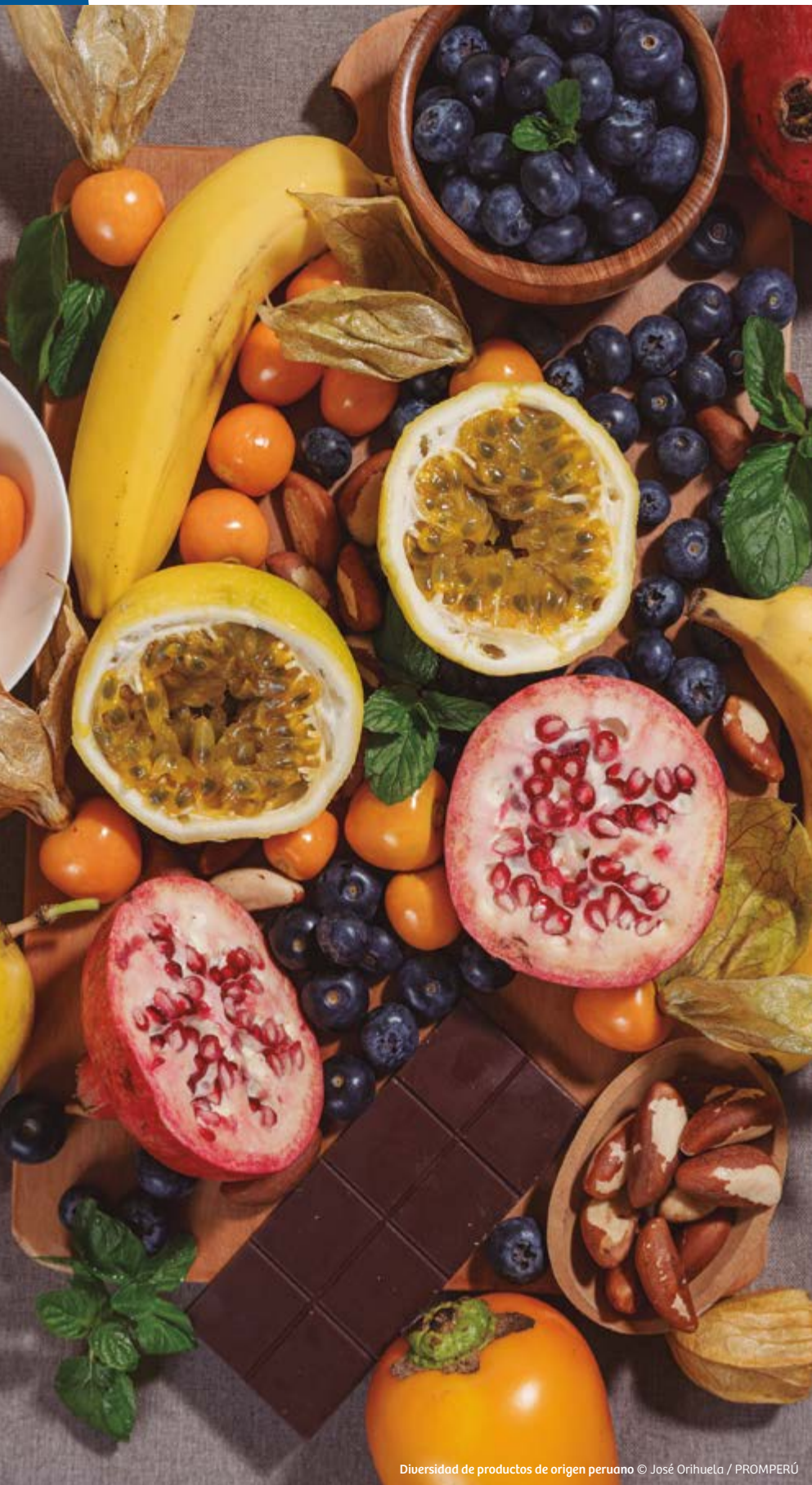
Diversidad de productos de origen peruano