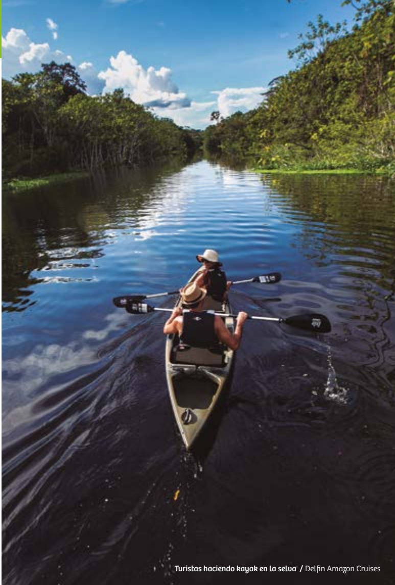
Turistas haciendo kayak en la selva