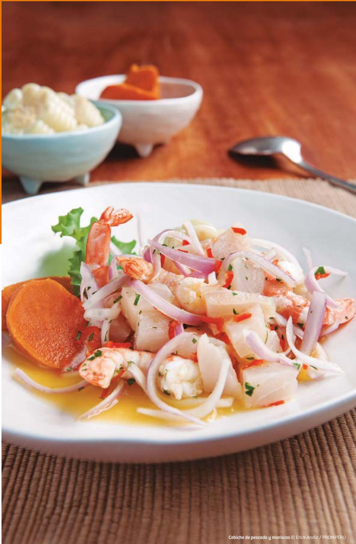
Cebiche de pescado y mariscos