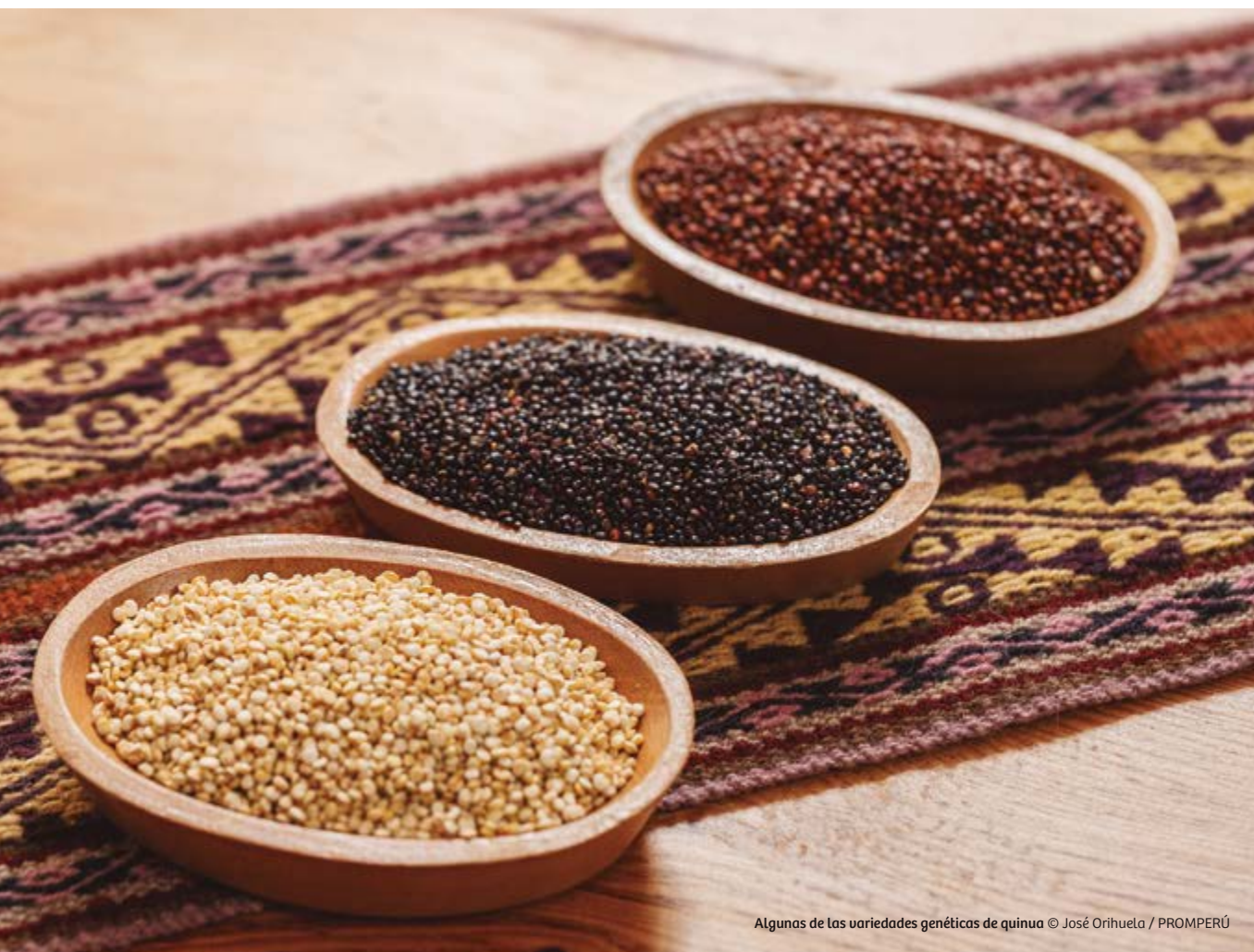
Algunas de las variedades genéticas de quinua