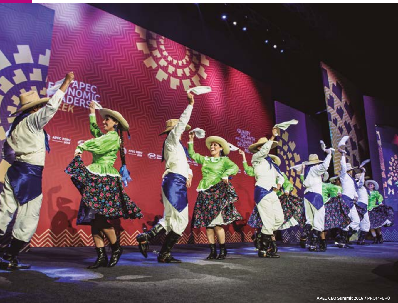
APEC CEO Summit 2016

y desde ahí se hacen conexiones con los principales destinos turísticos del país. El turismo de reuniones en el país ha experimentado un desarrollo considerable, fruto del trabajo conjunto entre el sector público y los burós regionales. El Perú se ha consolidado como el destino perfecto para organizar y celebrar turismo de reuniones, incentivos, congresos y exposiciones (MICE, por sus siglas en inglés). En este contexto, se puede afirmar que es el lugar ideal para establecer contactos y cerrar acuerdos comerciales. La gran recomendación para quienes realicen turismo MICE es extender su estadía en el país y recorrer algunos de los destinos turísticos más emblemáticos: conocer las distintas caras de Lima, la colonial, la moderna, y saborear su exquisita gastronomía.