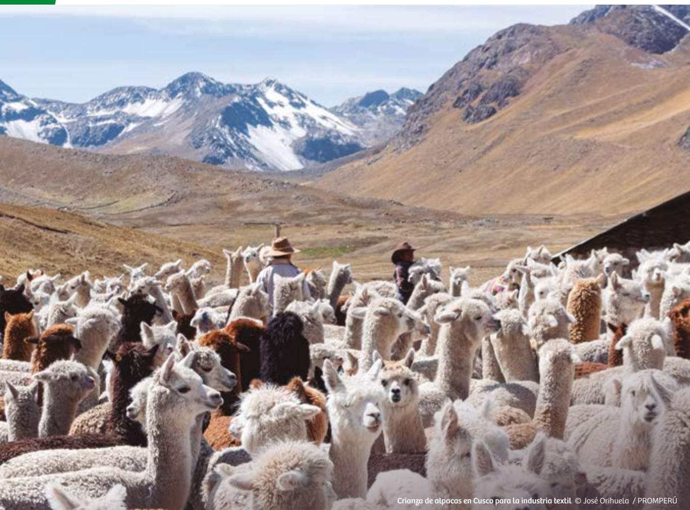
Crianza de alpacas en Cusco para la industria textil