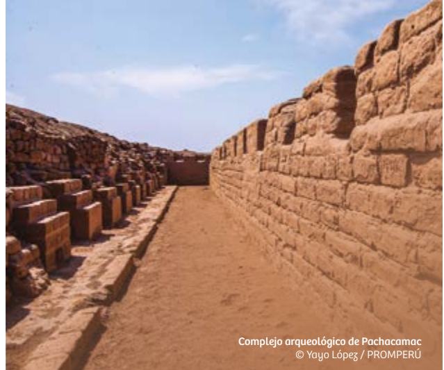
Complejo arqueológico de Pachacamac