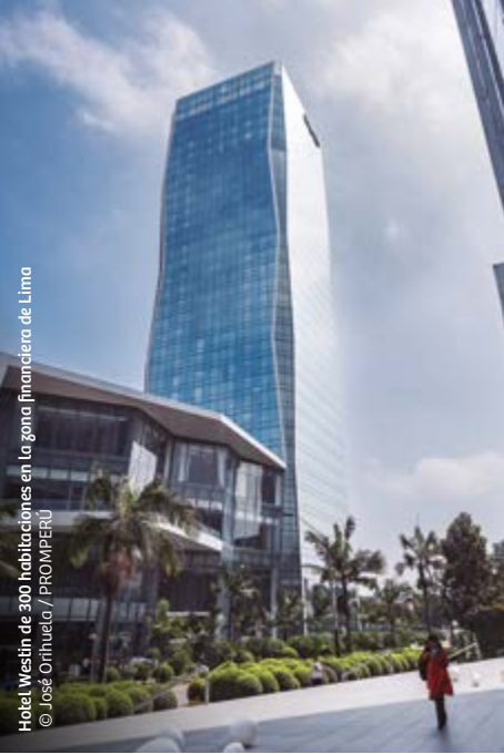
Hotel Westin de 300 habitaciones en La zona financiera de Lima