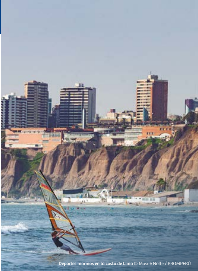
Deportes marinos en la costa de Lima