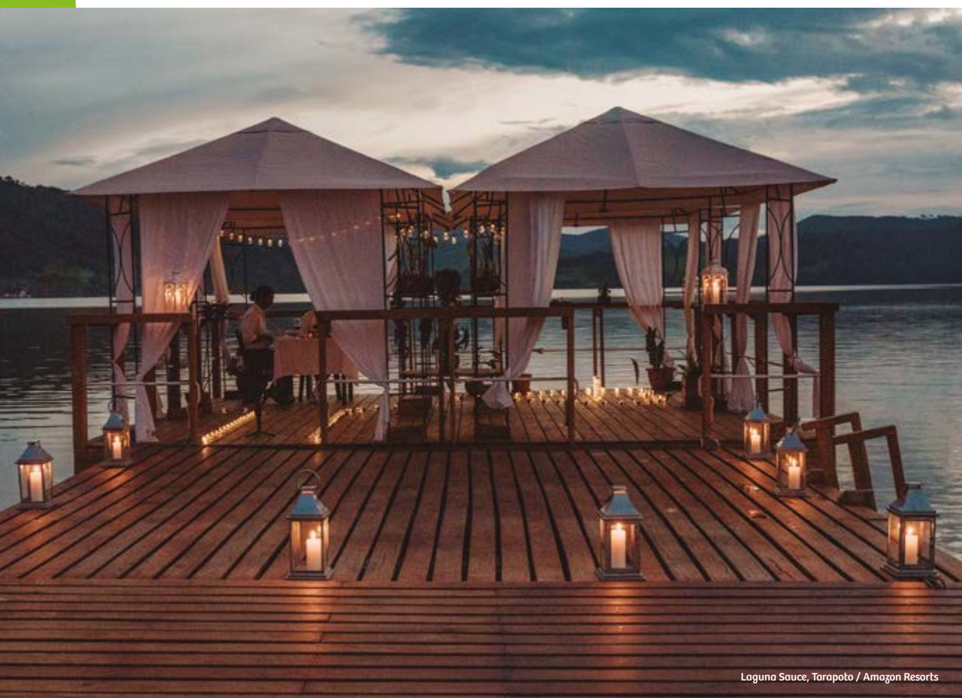
Laguna Sauce, Tarapoto / Amazon Resorts