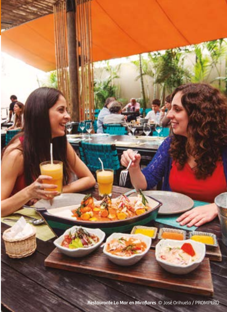
Restaurante La Mar en Miraflores